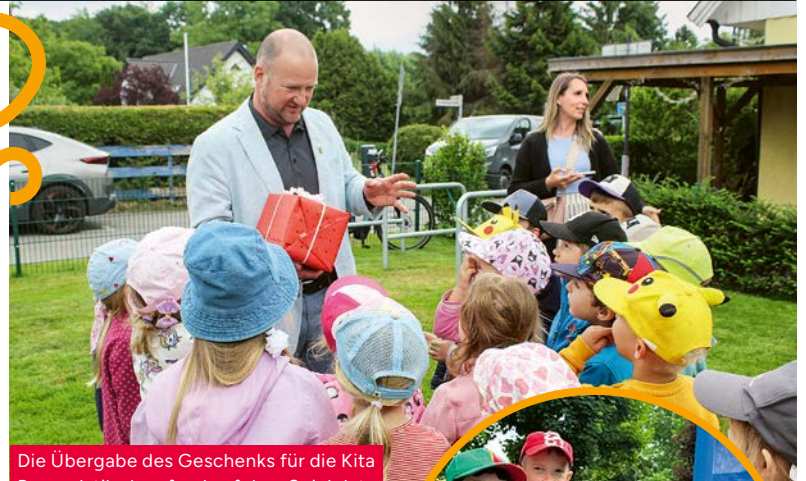
Die Übergabe des Geschenks für die Kita Rumpelstilzchen fand auf dem Spielplatz in der Erdebergstraße statt.