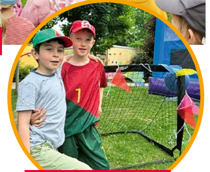
Kinder der Kita Birkenpilz freuen sich über ein neues Fußballtor