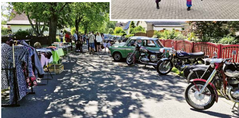
Gemeinschaft, Gespräche und ein Hauch Nostalgie in der Bayernstraße.