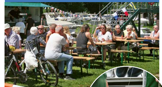
Die Gäste kommen beim gemeinsamen Essen miteinander ins Gespräch.

Text: Gemeinde Birkenwerder