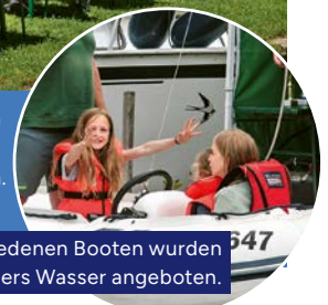
Mit verschiedenen Booten wurden Fahrten übers Wasser angeboten.