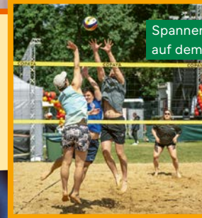
Spannendes Volleyballturnier auf dem Birkenfest

Text: Gemeinde Birkenwerder, Fotos: Linnard Gordalla