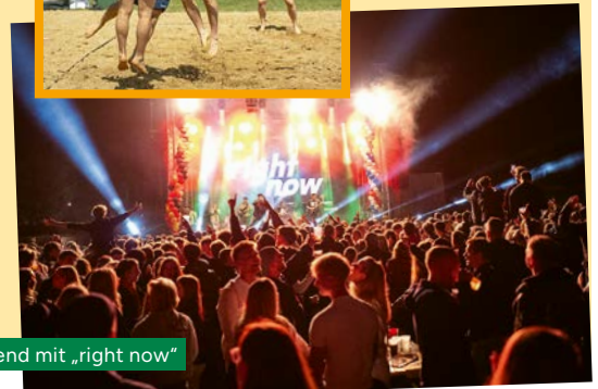
Konzert am Abend mit „right now“