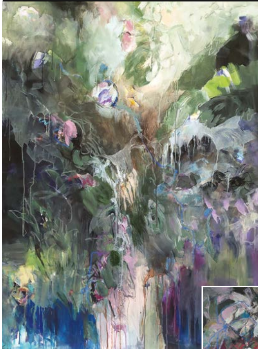
Susanne Zinser / Im Garten, Acryl