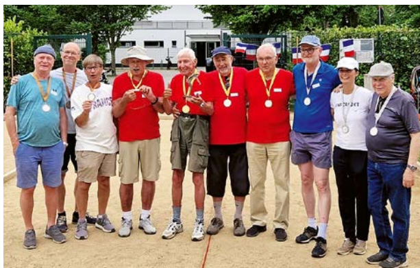
Die drei Siegerteams der diesjährigen Boule- Stadtmeisterschaft.