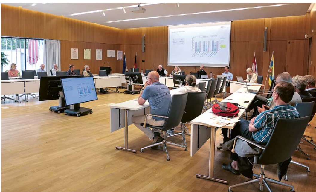
Bildunterschrift: Informationsveranstaltung zur Kommunalen Wärmeplanung im Ratssaal.

➔ Die kommunale Wärmeplanung wird vom 3. August bis 4. September im Rathaus und auf der Webseite