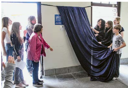
Gemeinsame Enthüllung des Gedenkzeichens im Bahnhofsgebäude Birkenwerder.