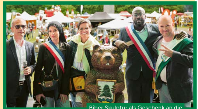
Biber Skulptur als Geschenk an die Delegation aus Frankreich

Das diesjährige Birkenfest am 12. und 13. Juni stand im Zeichen des 60-jährigen Jubiläums der Städtepartnerschaft mit Villetaneuse. Gemeinsam mit Gästen aus Frankreich und aus Litauen feierten die Besucherinnen und Besucher ein zweitägiges Fest mit einem abwechslungsreichen Bühnenprogramm, bunten Ständen, einer Freiluftausstellung, einem Volleyballturnier und als großes Highlight dem