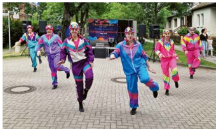
Die Fidelen Rixdorfer im Ski-Look: mit Schwung, Farbe und bester Stimmung auf dem Bayernstraßenfest.