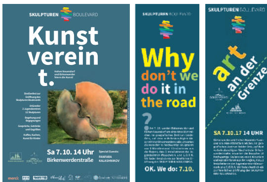
Poster und Handouts zur Bewerbung der ersten Ausstellung auf dem Skulpturen Boulevard, August/September 2017

Dies wird in dem Pilotprojekt von Bürgern für Bürger zum Nachahmen angeregt auf einer Kunst-Straße zwischen der Gemeinde Birkenwerder und der Stadt Hohen-Neuendorf im Norden von Berlin. Dieser öffentliche Raum mitten im Grünen, räumlich attraktiv definiert durch zahlreiche Beiträge regionaler und international bekannter Künstler und die programmatische Vielsprachigkeit ganz unterschiedlicher Auffassungen von Skulptur, verbindet