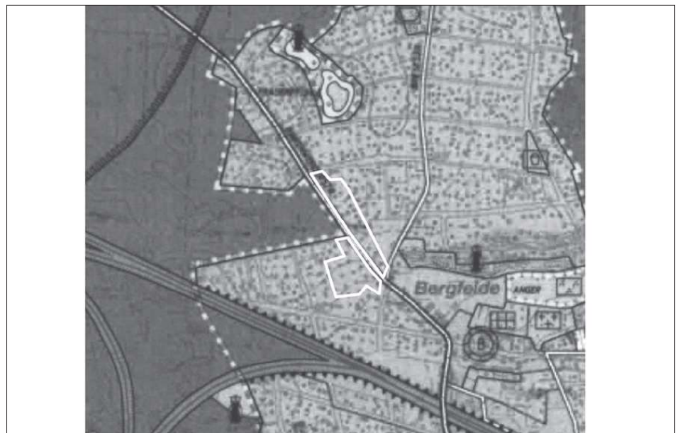
Auszug Flächennutzungsplan Stand Oktober 2001