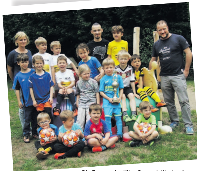
Die Zwerge der Kita „Rumpelstilzchen“ gewannen die diesjährige Kita-Fußball-WM der Märkischen Allgemeinen Zeitung.