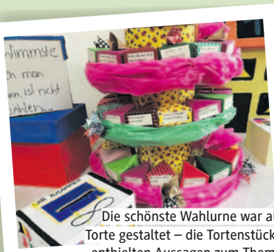
Die schönste Wahlurne war als Torte gestaltet – die Tortenstücke enthielten Aussagen zum Thema „lebendige Demokratie“.

BORGS DORF | Die schönste Wahlurne der Nordbahngemeinden kommt aus Borgsdorf. Die Kinder und Jugendlichen des offenen Lücke-Treffs hatten in tagelanger Arbeit Kernaussagen gesammelt, was für sie „lebendige Demokratie“ bedeute, und diese auf gebastelten Tortenstücken zusammengestellt. Das Ergebnis: Demokratie ist eine bunte, fröhliche und sehr abwechslungsreiche Sache – wenn man denn wählt! Und das tat der Nachwuchs dann auch: Insgesamt 146 junge Menschen wählten in drei Borgsdorfer Wahllokalen ideell ihre kommunale Interessenvertretung – „die Großen“ gaben zudem ihre Stimme für Europa ab. Der Verein Nordbahngemeinden mit Courage unterstützte die Demokratiebildung bei den Heranwachsenden aktiv in der Vorbereitung, Durchführung und Auswertung der Wahl. Zusätzlich zur Beteiligung an der bundesweiten U18-Wahlinitiative hatte der Verein den Wettbewerb um die schönste Wahlurne auslobt. (Text/Foto: af)