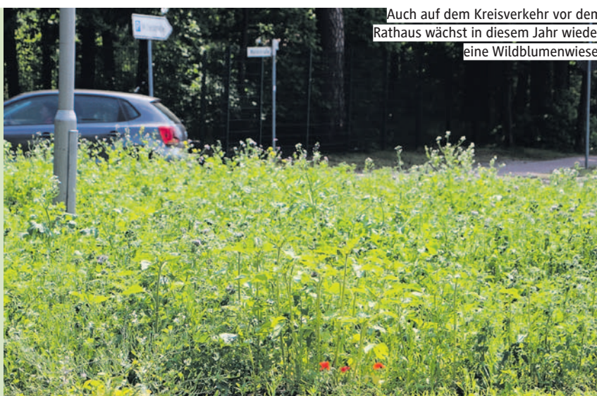
Auch auf dem Kreisverkehr vor dem Rathaus wächst in diesem Jahr wieder eine Wildblumenwiese.

Bei dem Saatgut handelt es sich teilweise um die Mischung, die die Stadt im Rahmen des Bürgerhaushaltsprojektes „Insektenfreundliches Saat“ an interessierte Bürgerinnen und Bürger herausgegeben hat, und um weiteres gebietsheimisches Saatgut, empfohlen vom NABU. (Text/Foto: sk)