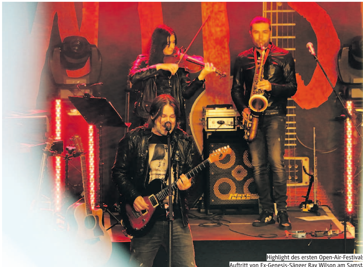
Highlight des ersten Open-Air-Festivals war der Auftritt von Ex-Genesis-Sänger Ray Wilson am Samstagabend.