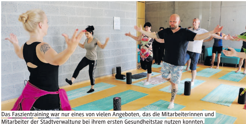
Das Faszientraining war nur eines von vielen Angeboten, das die Mitarbeiterinnen und Mitarbeiter der Stadtverwaltung bei ihrem ersten Gesundheitstag nutzen konnten.