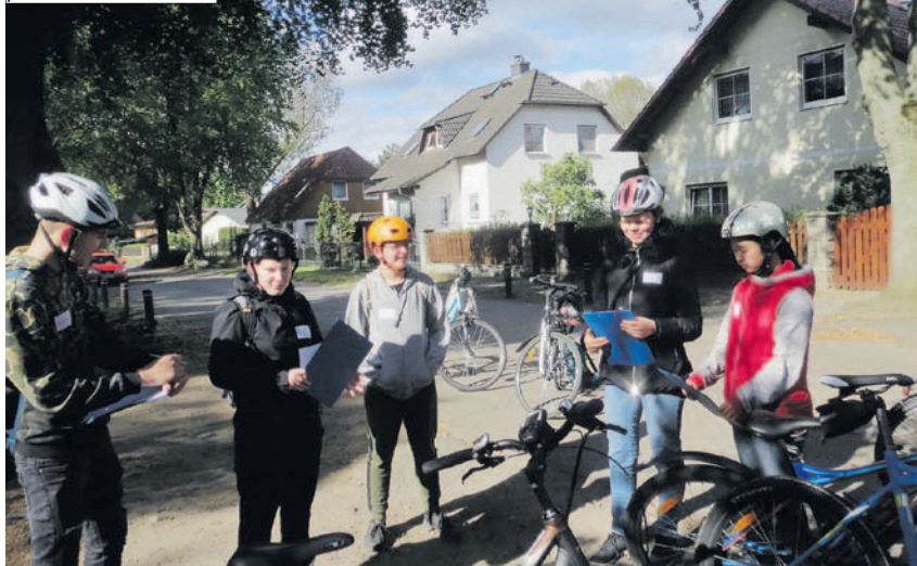
Schülerinnen und Schüler der Regine-Hildebrandt-Gesamtschule analysieren einen Verkehrsknotenpunkt in Birkenwerder.