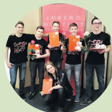
Nach dem erfolgreichen Abschneiden beim Regionalfinale Nord-Ost begeisterte die Band Systemfehler auch beim Landesfinale in Berlin.