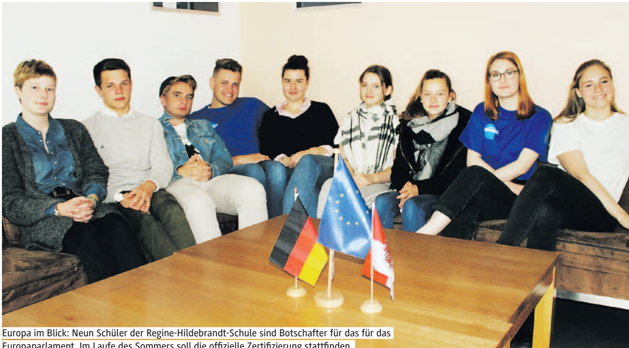
Europa im Blick: Neun Schüler der Regine-Hildebrandt-Schule sind Botschafter für das für das Europaparlament. Im Laufe des Sommers soll die offizielle Zertifizierung stattfinden.

Die Regine-Hildebrandt-Schule in Birkenwerder ist auf einem guten Weg, zu einer von insgesamt 60 deutschen Botschafter-Schulen für das Europäische Parlament zu werden – als einzige im Land Brandenburg. Neun Jugendliche haben sich dafür in den vergangenen Monaten besonders stark mit der EU beschäftigt und wollen ihr Wissen an die Mitschüler weitergeben.