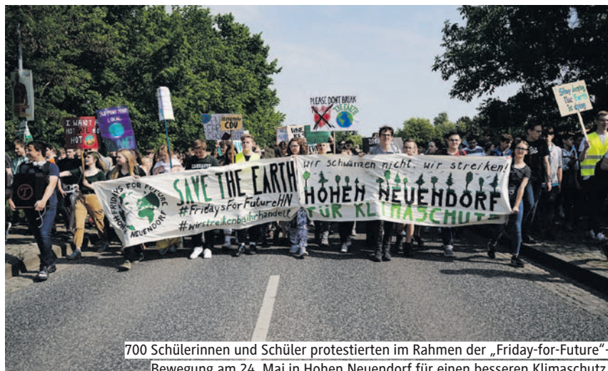
700 Schülerinnen und Schüler protestierten im Rahmen der „Friday-for-Future“-Bewegung am 24. Mai in Hohen Neuendorf für einen besseren Klimaschutz.

neun und elf Uhr einen Projektblock eingerichtet, um den Schülern eine Teilnahme an der Demonstration zu ermöglichen. Auch viele Lehrer der Schule zogen mit den Schülern durch Hohen Neuendorf, um sich für den Klimaschutz einzusetzen. Die Route führte vom Schulgebäude über die Kaufland-Kreuzung, vorbei an Friedhof, Wasserturm und Rathaus über die B96 bis zum S-Bahnhof. Dabei begleitete die Hohen Neuendorfer Polizei den Zug und sperrte auch die betroffenen Straßen bis zum Bahnhofsvorplatz, an dem sich die Masse mit lauter Musik zur anschließenden Kundgebung einfindet. Hier spielten nach einigen kurzen, aber prägnanten Reden zwei Bands. Zusätzlich machte die Menge mit Sprüchen wie „Wer nicht springt, der ist für Kohle!“ oder „Es gibt kein Recht auf Kohlebaggerfahren!“ auf sich aufmerksam. Um elf Uhr wurde die Demonstration offiziell beendet. (Text/Foto: Friederike Kersten, MCG)