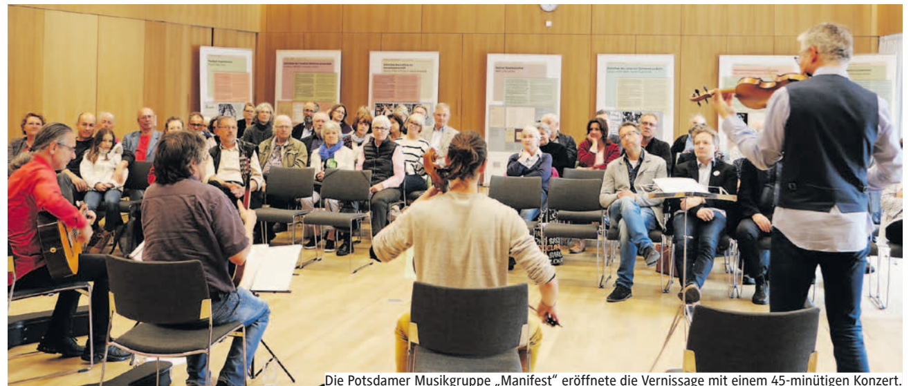
„Die Potsdamer Musikgruppe „Manifest“ eröffnete die Vernissage mit einem 45-minütigen Konzert.“